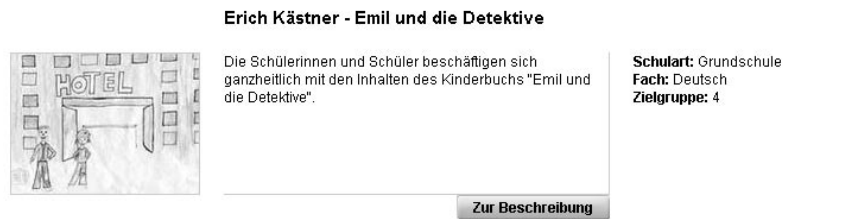
Darstellung eines Unterrichtsmoduls