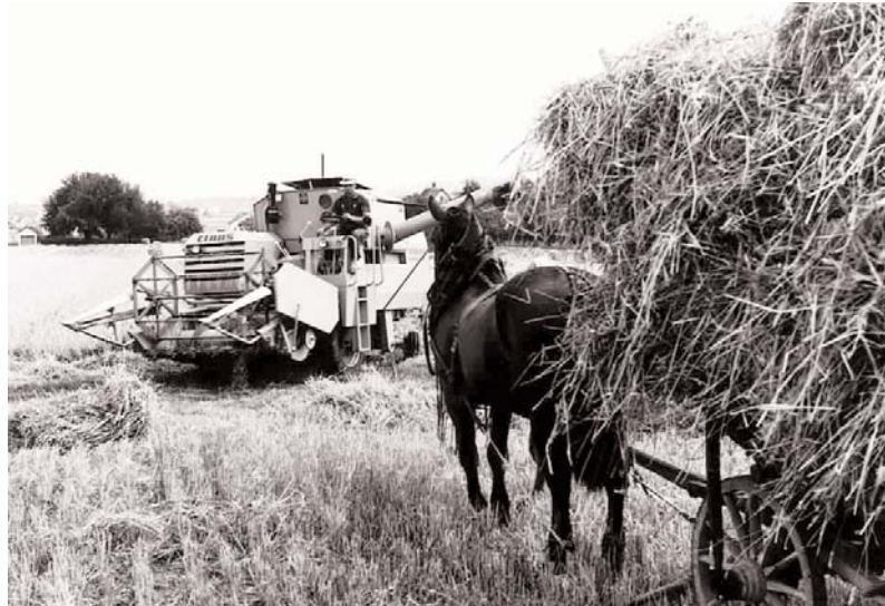
Getreideernte: Pferdefuhrwerk und Mähdrescher 1970

mehr Steinhorsts besonderer Sinn für die zeit- und sozialgeschichtliche Relevanz einer Situation, eines Momentes, der sich in genau getroffenen Aufnahmen äußert. So stehen Fotos, die die Würde von körperlich hart arbeitenden Menschen vor Augen führen, neben solchen, in denen die bizarre Ästhetik moderner Produktionsanlagen eingefangen ist; oder es finden sich reizvolle Aufnahmen von Naturdetails neben solchen, in denen ganz sachlich die Bedrohung eben dieser Schönheit durch Zersiedelung und Umweltverschmutzung gezeigt wird.