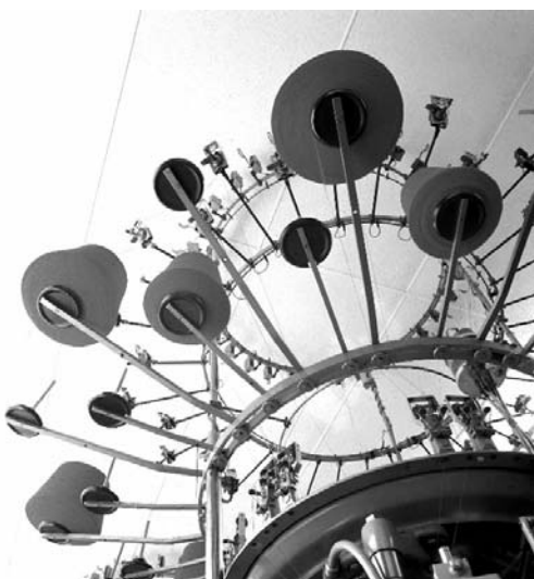
Strickmaschine in der Strickwarenfabrik Böhmeler in Pfullingen 1970

Die Sichtung und Aufarbeitung der Fotos von Hans Steinhorst gehört zu den Aufgaben des Fotoarchivs des LMZ. Dort wird auch anlässlich seines 30. Todestages eine Ausstellung vorbereitet, die einen Überblick über das vielfältige Schaffen Hans Steinhorsts geben wird.