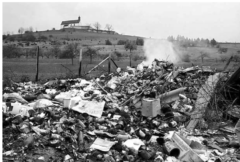
Müllplatz bei Wurmlingen ca. 1970