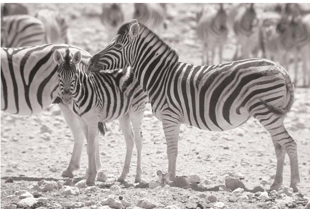
Damara-Zebras aus Afrika

Für den Einsatz im Biologieunterricht gibt es neben einer großen Bandbreite an Tierarten in ihrem natürlichen Lebensraum auch viele Themen, die eher den symbolischen Bereich der Bildanfragen abdecken, z. B. Bionik: Technik, die der Natur abgeschaut ist, der tropische Regenwald mit seinen Bewohnern, die Vernichtung von Lebensräumen etc. Der Hauptbestand