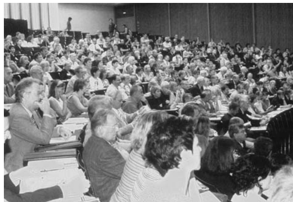
Hohes Interesse am Gymnasium der Zukunft

gesichts der Kürzung der Schulzeit schwer werden, verschiedenen Kompetenzen integrativ Raum zu bieten. Die „Konzentration des Bildungskanons auf das Wesentliche“ geht auf Kosten der Breite und Vollständigkeit, zumal bei einem ständig steigenden Bestand an scheinbar unverzichtbarem (?) Spezialwissen. Exemplarische Vertiefung im Fachunterricht ist die einzige Alternative und sie lässt sich durchaus mit fächerübergreifend koordinierter, mithin kontinuierlicher methodischer Schulung verbinden.